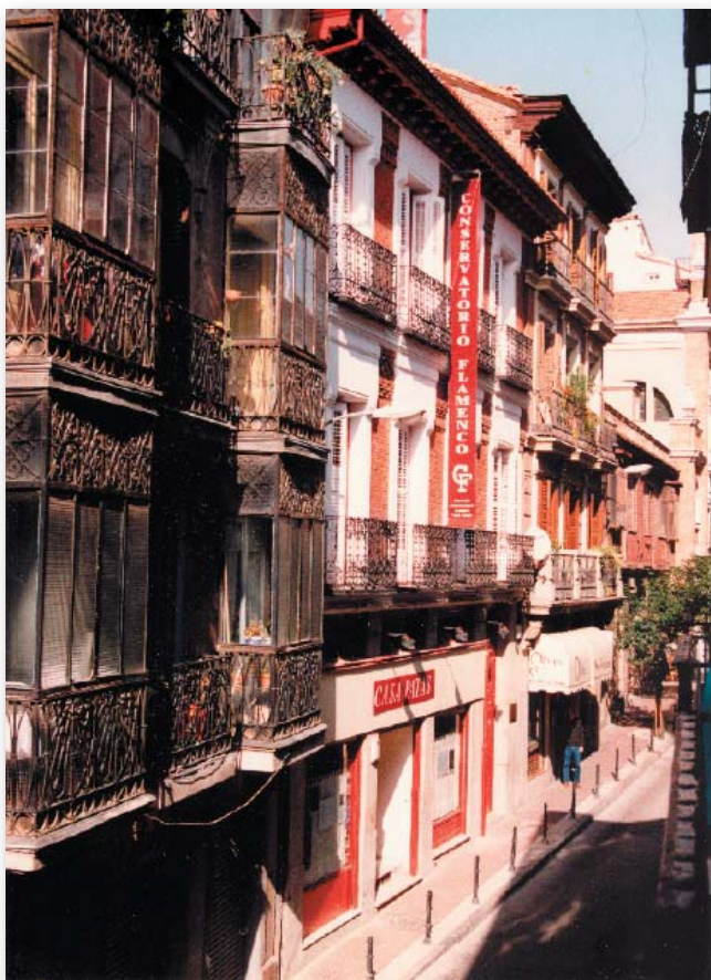
La Fundación Casa Patas se ubica en pleno centro de Madrid

La Fundación Conservatorio Flamenco Casa Patas nació en el año 2000 con el fin de convertirse en un centro en el que se aglutinasen todas las actividades relacionadas con la enseñanza, investigación y promoción del cante, el toque y el baile flamenco, así como la promoción de la gastronomía y la cultura española.