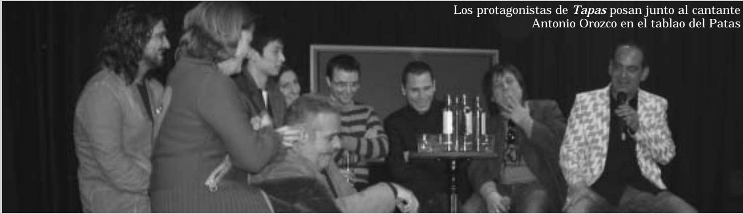
Los protagonistas de Tapas posan junto al cantante Antonio Orozco en el tablado del Patas

PINTOS EN EL CONSERVATORIO. El trabajo da sus frutos y, gracias a él, alumnos de baile, canto, guitarra y percusión de la Fundación Casa Patas han montado y protagonizado sus propias actuaciones. La primera se llevó a cabo durante la fiesta de Navidad del Conservatorio, ante la mirada de los compañeros. La segunda para el público de la Asociación Cultural de Casillas, en Ávila, hasta donde se trasladaron siete de nuestros alumnos más destacados. Por otra parte, estudiantes estadounidenses celebraron con flamenco la llegada del nuevo año. El bailar José Barrios, acompañado de Leilah Broukhim y el guitarrista Luis Miguel manzano fueron los encargados de amenizar la fiesta.