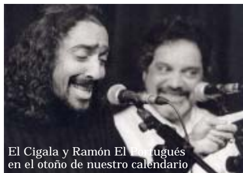
El Cigala y Ramón El Portugués en el otoño de nuestro calendario

Los ojos de El Cigala ven más allá del Flamenco y su voz se proyecta allende las fronteras. Desde el milagro de Lágrimas Negras este cantaor de rostro genuinamente gitano ha saltado del anonimato roto por los aficionados al reconocimiento internacional de los más diversos públicos. Quedaron atrás los años en que los nervios se convertían en fieles compañeros durante sus actuaciones en Casa Patas para -ahora- permitirse el lujo de elucubrar alrededor del flamenco al antojo de los grandes. Cuatro temas por bulerías, tangos, rumbas y solos de voz y guitarra componen Picasso en mis ojos , un disco auténtico pero más cercano a los menos hechos al género que a los amantes de lo jondo.