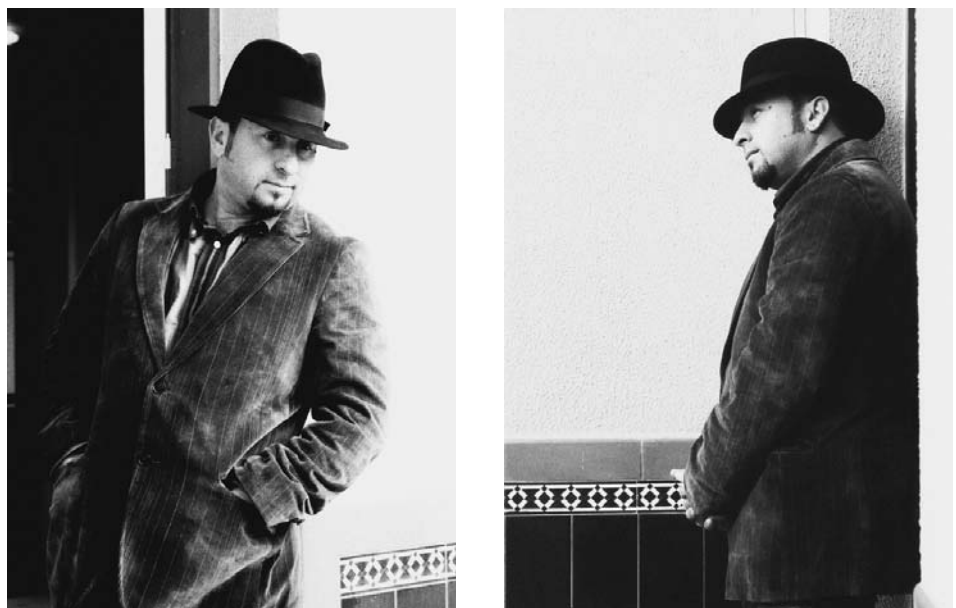
El Barrio ha hecho de su sombrero una seña de identidad