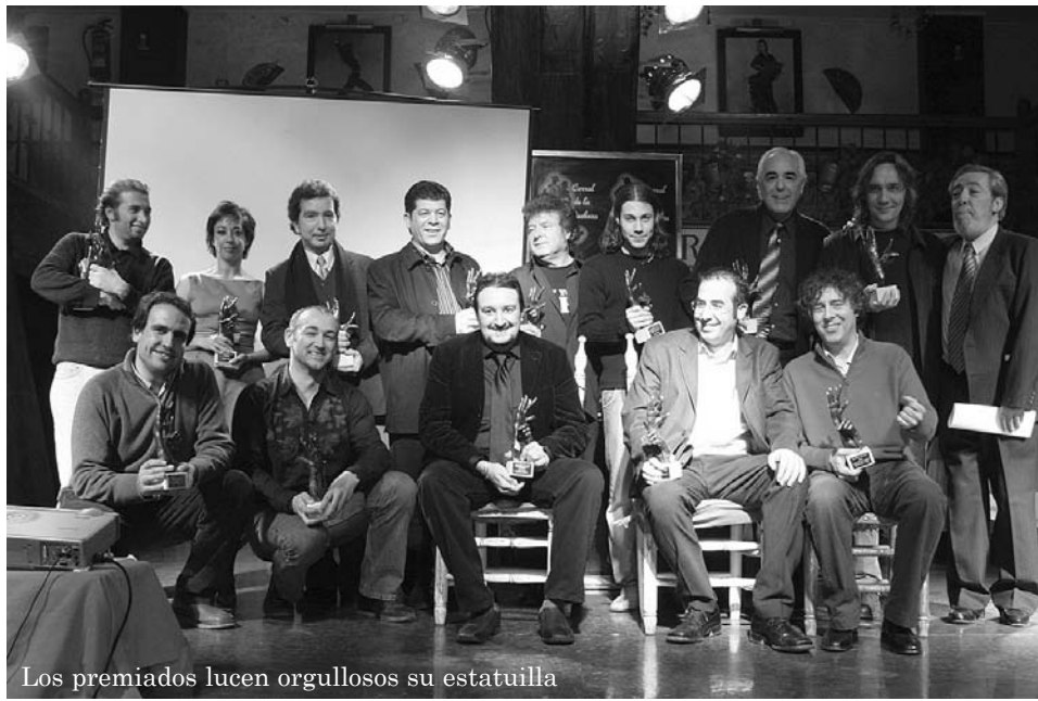
Los premiados lucen orgullosos su estatuilla

Año tras año, la colaboración desinteresada del tablao Casa Patas en la celebración y difusión de los Premios Flamenco Hoy le ha otorgado a esta casa el reconocimiento especial durante la celebración de la presente edición de estos galardones, que se crearon hace siete años con la intención de convertirse en el reflejo de la opinión independiente de los expertos sobre los mejores flamencos del año. Entre artistas, críticos, aficionados y curiosos, más de doscientas personas se citaron en la noche de entrega junto a un jurado compuesto por una cuarentena de críticos. Los más destacados del 2005 fueron, entre otros, Enrique Morente, Vicente Amigo, Javier Limón, Jesús de Rosario, Belén Maya, Israel Galván o Jorge Pardo.