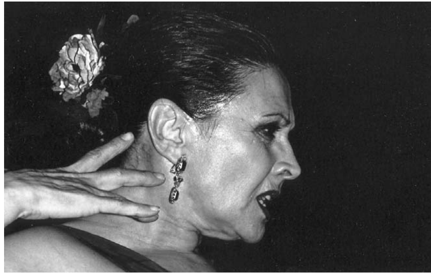
La fuerza de Merche Esmeralda queda patente en esta fotografía