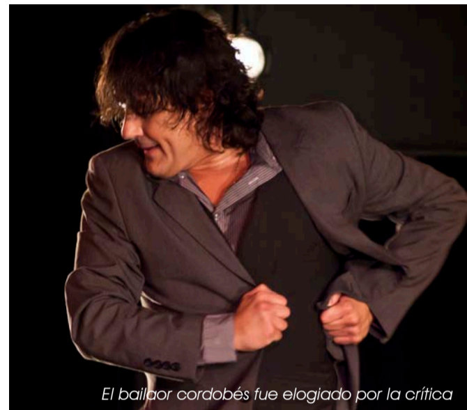
El bailaor cordobés fue elogiado por la crítica

Japón en enero, donde por una parte coreografié el espectáculo Al-Andalus en Parque España y, por otra, trabajando como bailaor y coreógrafo en la compañía de María Pagés. Cuando regrese a España seguiré trabajando con Por si acaso amanece .